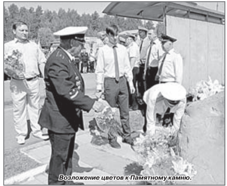
Возложение цветов к Памятнику.

Отдавая дань военным строителям, построившим наш город, который стал для многих моряков родным домом, и лично его основателю, а также военным морякам, защитникам Родины, прошла тор-