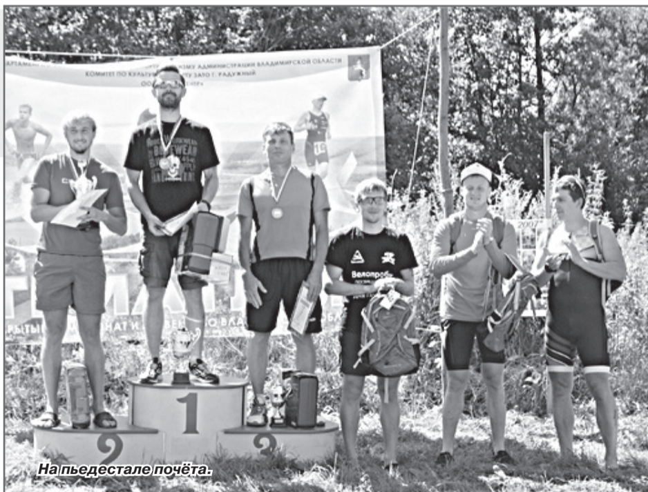
На пьедестале почёта.